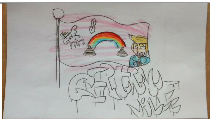
Le drapeau de Gertru-Ville.